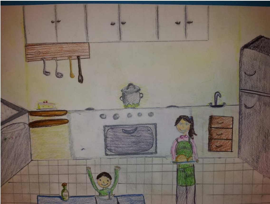
Figura 17 ruoli in famiglia_stoppani_disegno 11_gaia