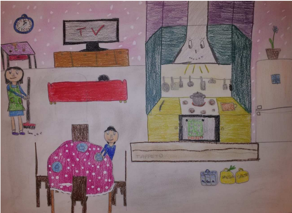
Figura 15 ruoli in famiglia_stoppani_disegno 9_imen