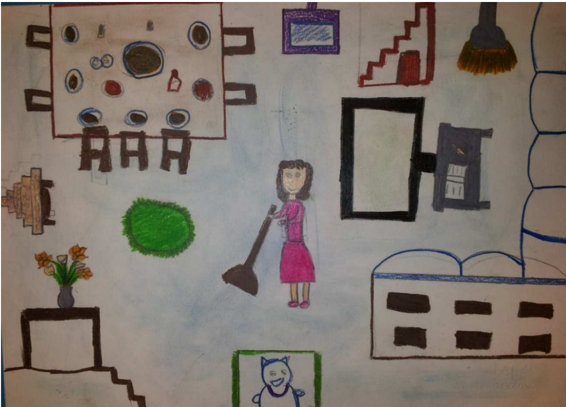
Figura 16 ruoli in famiglia_stoppani_disegno 10_juliette