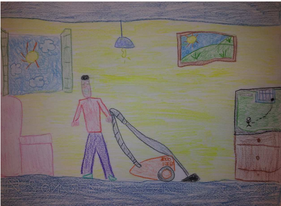
Figura 12 ruoli in famiglia_stoppani_disegno 6_mirko