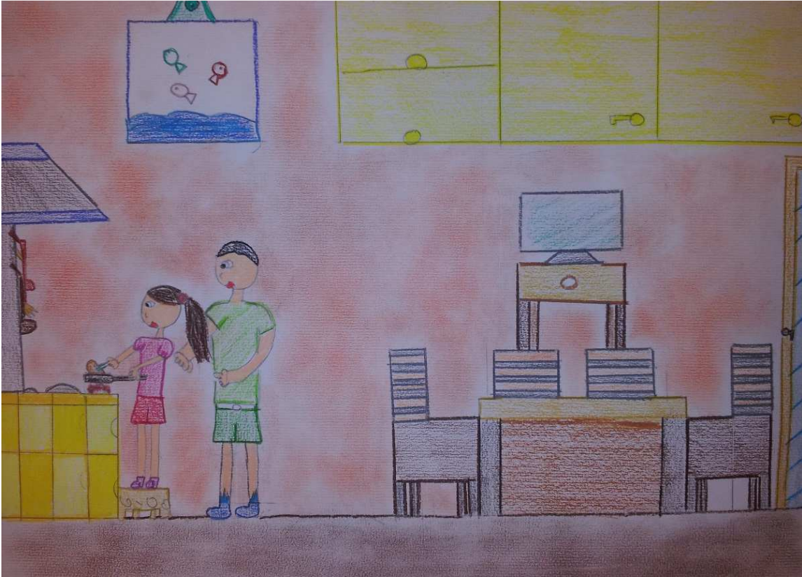
Figura 7 ruoli in famiglia_stoppani_disegno 1_giorgia