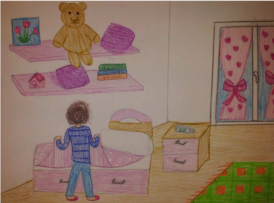
Figura 11 ruoli in famiglia_stoppani_disegno 5_senza nome