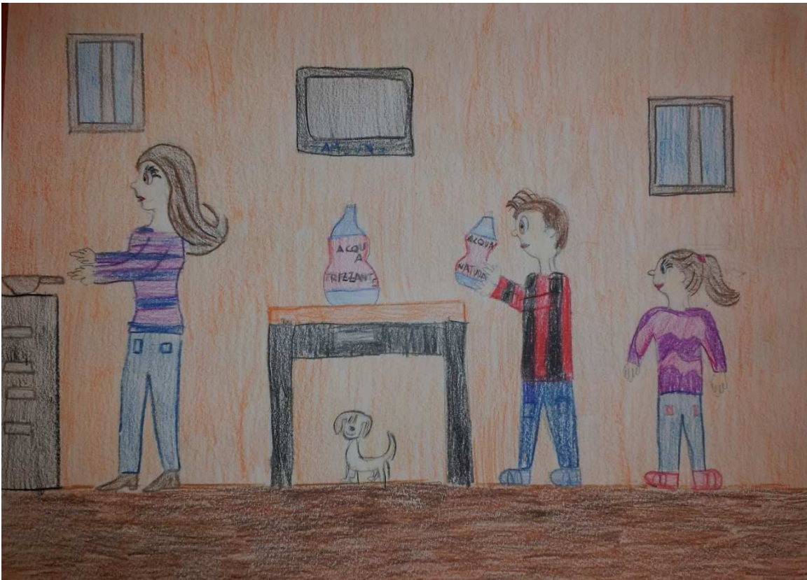
Figura 10 ruoli in famiglia_stoppani_disegno 4_lorenzo