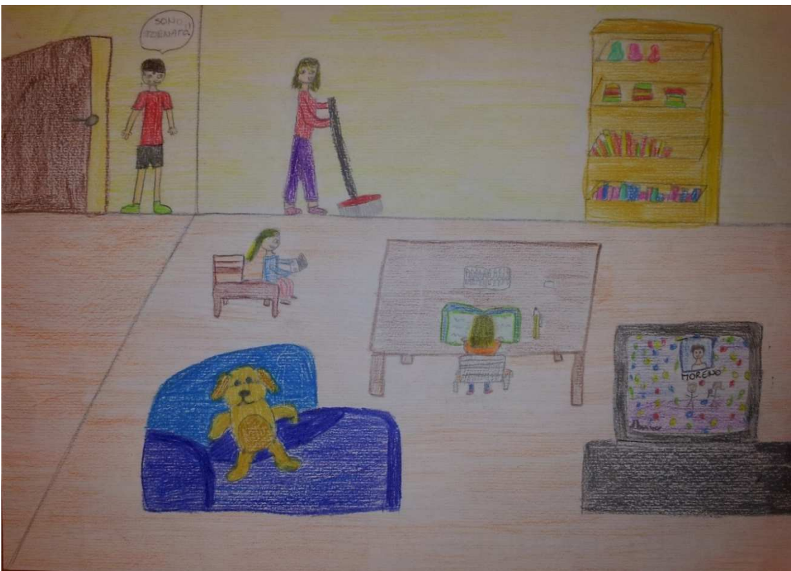
Figura 20 ruoli in famiglia_stoppani_disegno 14_senza nome