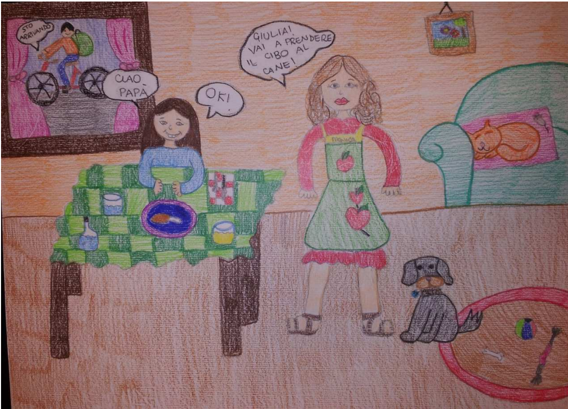
Figura 23 ruoli in famiglia_stoppani_disegno 17_giulia