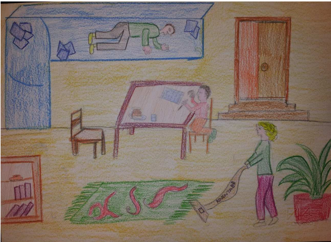
Figura 22 ruoli in famiglia_stoppani_disegno 16_federico