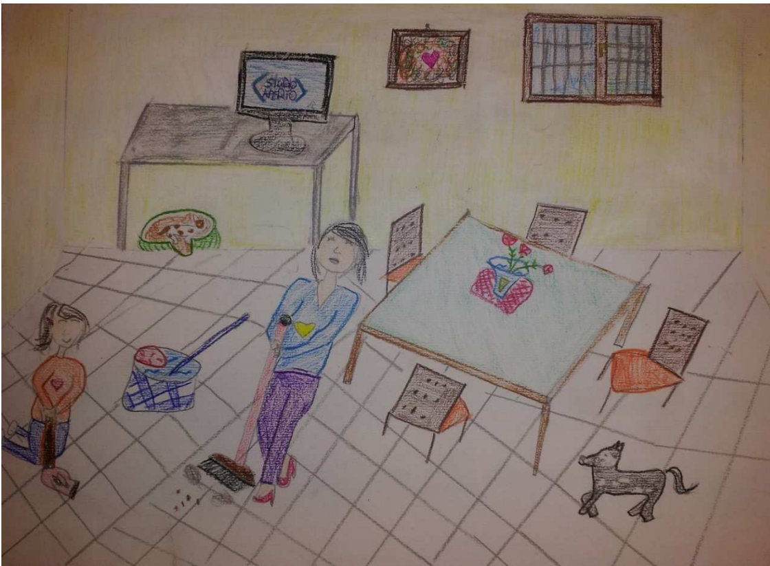
Figura 14 ruoli in famiglia_stoppani_disegno 8_giulia