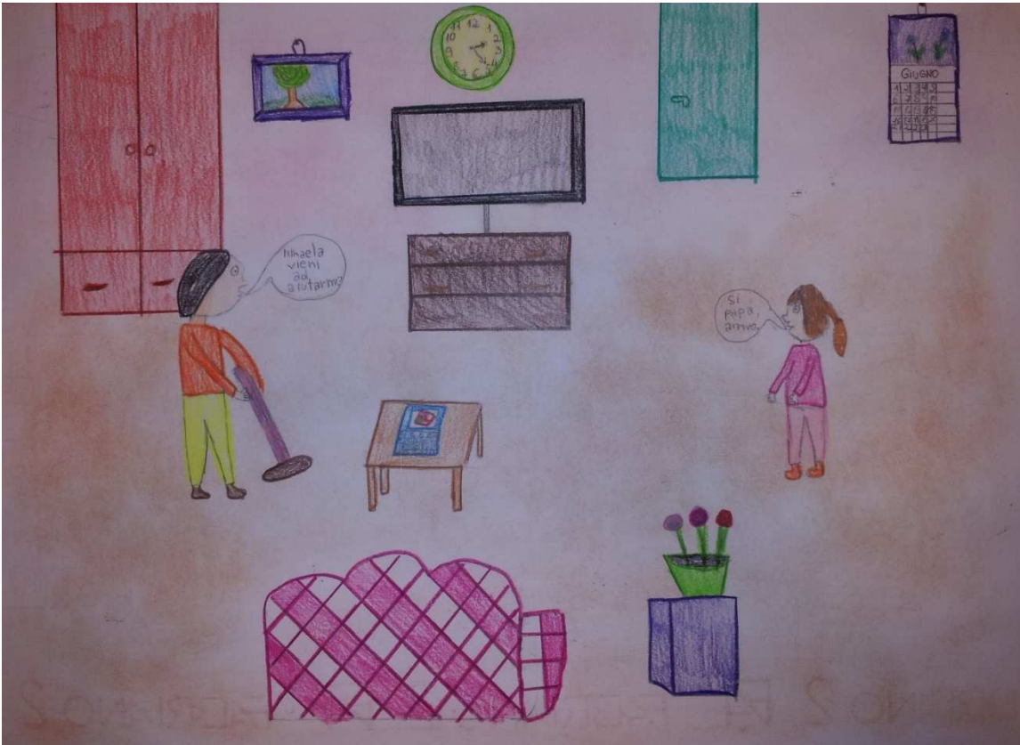
Figura 19 ruoli in famiglia_stoppani_disegno 13_michela