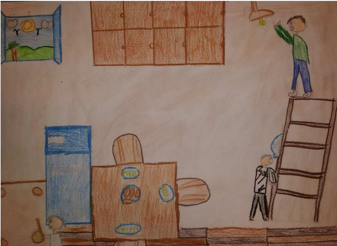
Figura 13 ruoli in famiglia_stoppani_disegno 7_al alaseu