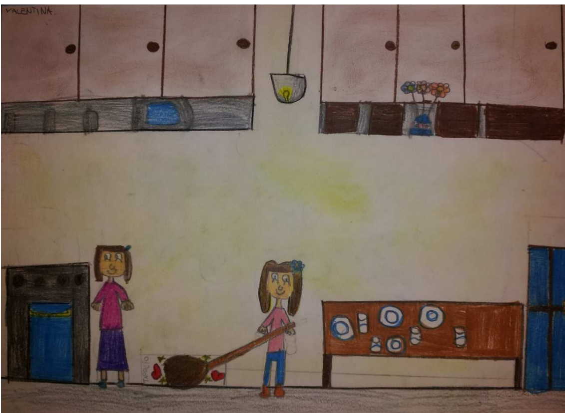
Figura 18 ruoli in famiglia_stoppani_disegno 12_valentina