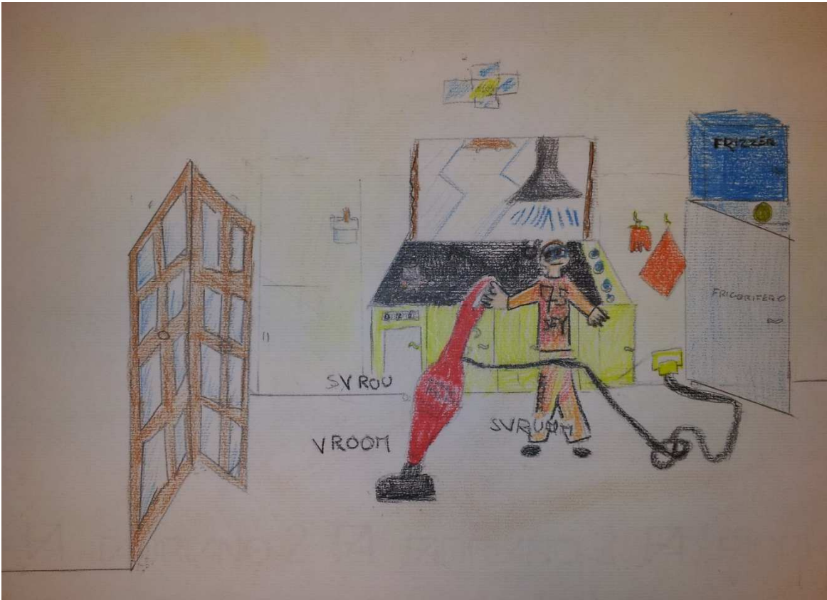
Figura 9 ruoli in famiglia_stoppani_disegno 3_michele