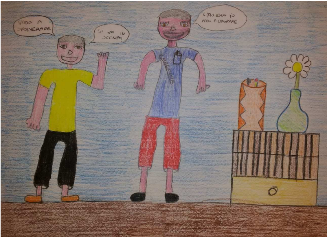
Figura 21 ruoli in famiglia_stoppani_disegno 15_emanuele